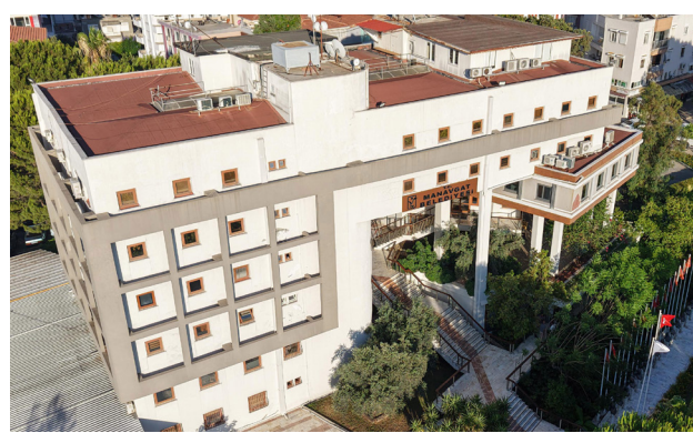
ABB TV 'FERAHLADI'